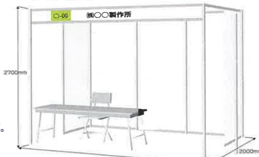
1小間分の展示ブースイメージ