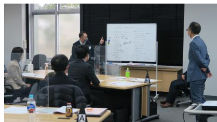
【参加型の実践講義】