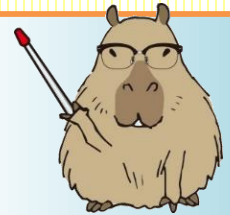
講師：関 悟 中小企業診断士

的確な経営課題を、合理的に設置するための方法を解説します。今こそ、経営課題に向き合おう！