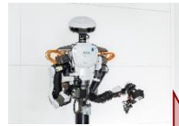
カワダロボティクス㈱ 「双腕型産業用ロボット NEXTAGE」