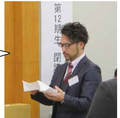
第12期生 有限会社吉成工具研磨 (栃木県さくら市)

私は12期生の会長として任命されましたが、今後はOBとして同じような思いや志を持つ後継者達に少しでも力添えが出来るよう努めていきたいと思っています。