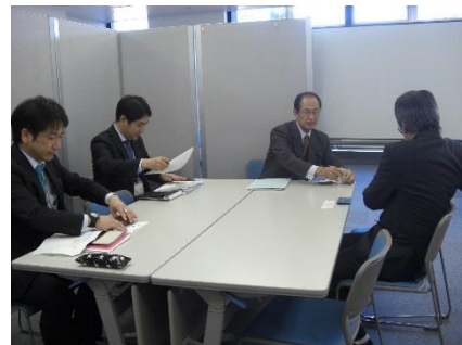
別室での個別面談の様子